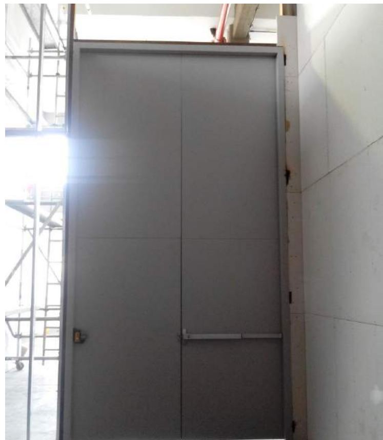
Puerta cortafuego Café Liofilizado de Colombia - Chinchiná, Caldas