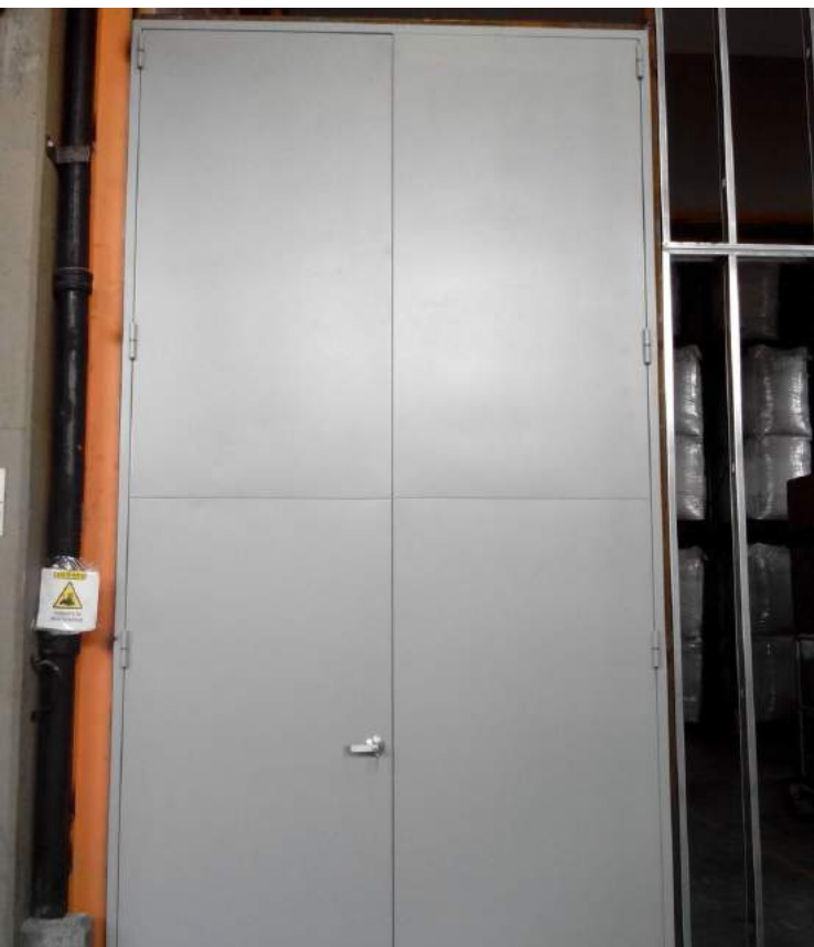
Puerta cortafuego Café Liofilizado de Colombia - Chinchiná, Caldas

“RECOMENDACIÓN MURO CORTAFUEGO”; Después de realizar la estimación de pérdida máxima probable, se expuso la necesidad de separar el área de almacenamiento de producto terminado ubicado en el bloque principal del proceso productivo, (plantas de liofilización), ya que éste representa un punto crítico debido a la alta carga de material combustible y presencia de fuentes de ignición como cargadores de baterías, que en caso de un conato de incendio en las condiciones actuales facilitaría la propagación del fuego generando una afectación severa.