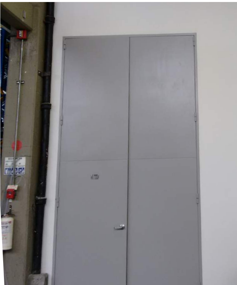
Puerta Cortafuego Café Liofilizado de Colombia - Chinchiná, Caldas

Finalizando el proyecto se envió un manual de mantenimiento donde se dan las garantías e instrucciones respectivas, todos los elementos cortafuego instalados, además de las fichas técnicas y de seguridad de los materiales.