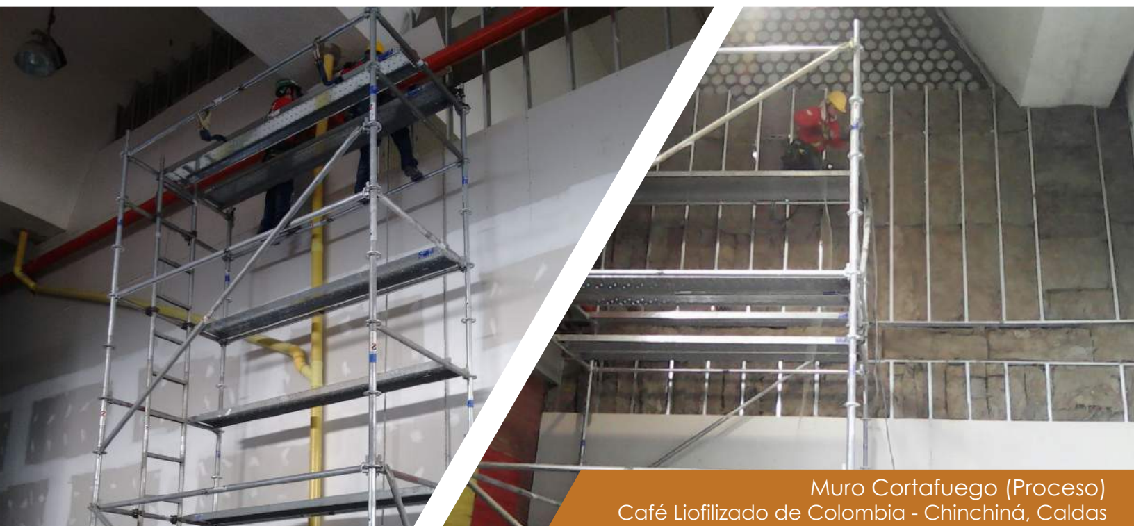
Muro Cortafuego (Proceso) Café Liofilizado de Colombia - Chinchiná, Caldas

La Federación Nacional de Cafeteros (FNC) está ubicada en la ciudad de Chinchiná, departamento de Caldas. Es una entidad sin ánimo de lucro que contribuye a promover el cultivo de café en Colombia y su exportación a mercados internacionales, con la misión de procurar el bienestar de los caficultores colombianos y que las comunidades cafeteras fortalezcan su tejido social.