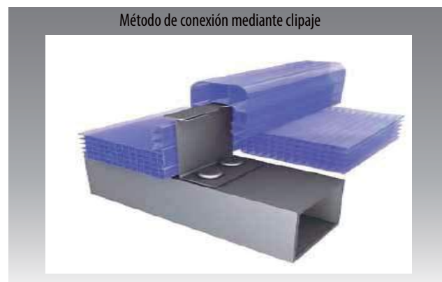
Método de conexión mediante clipaje

La estructura Microcell posibilita una difusión uniforme de la luz natural y ofrece un aspecto similar al vidrio. El reducido espacio entre las nervaduras, ideado específicamente para aplicaciones arquitectónicas con luz natural, brinda una calidad luminosa superior y un aspecto estéticamente atractivo, además de ofrecer una alternativa refinada al aspecto invernadero vinculado con láminas tradicionales de policarbonato de paredes dobles.